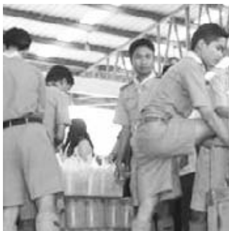
Pfadfinder aus dem Katastrophengebiet helfen, wo Hilfe benötigt wird.